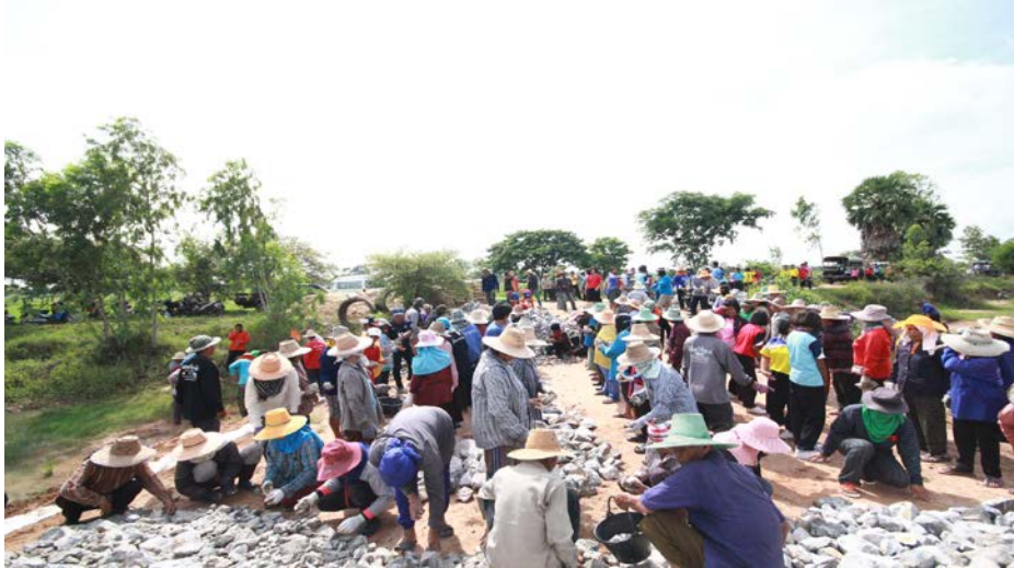
โครงการก่อสร้างฝายชะลอน้ำ(ฝายหินทิ้ง)