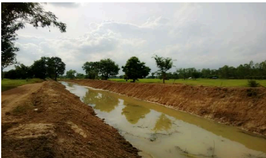
โครงการขุดลอกลำห้วย