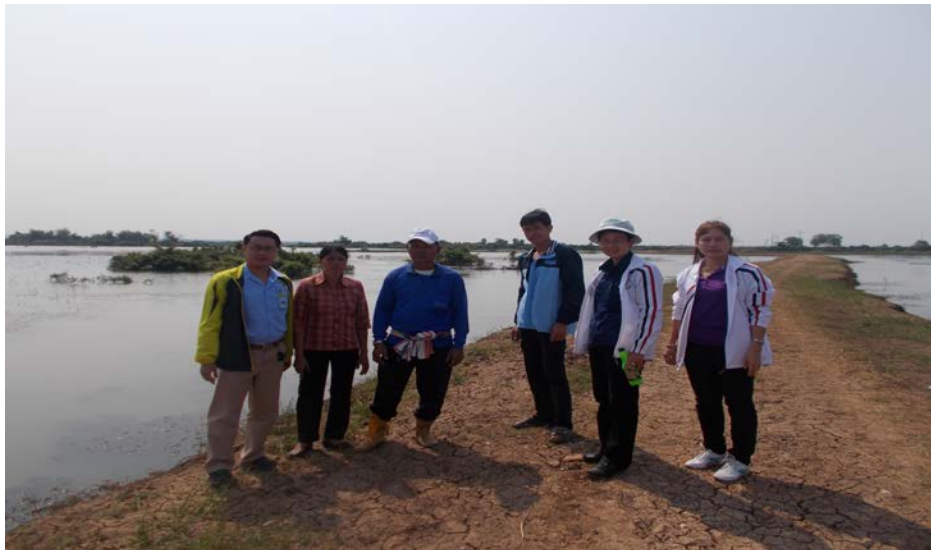
โครงการก่อสร้างพังกั้นน้ำ