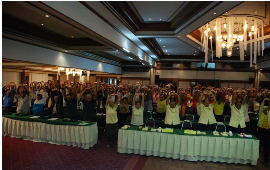
โครงการพัฒนาชีวิตผู้สูงอายุ