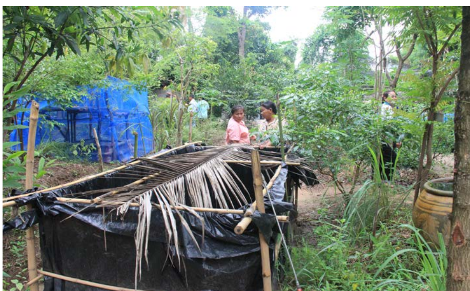
โครงการ 1 หมู่บ้าน 1 เศรษฐกิจพอเพียง (ศูนย์การเรียนรู้เศรษฐกิจพอเพียง อ.มัญจาคีรี)