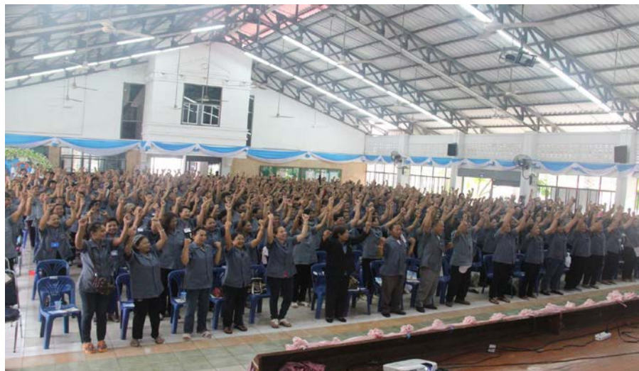
โครงการรวมพลังต่อต้านภัยยาเสพติด