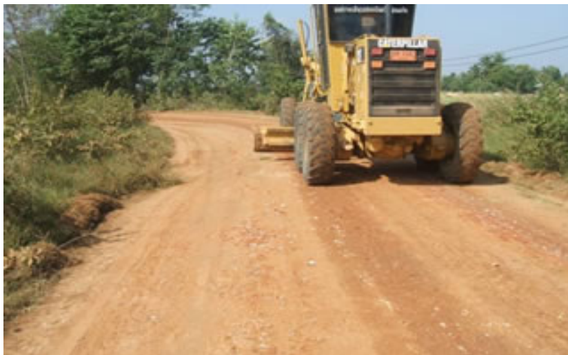
โครงการสร้างถนนลูกรัง