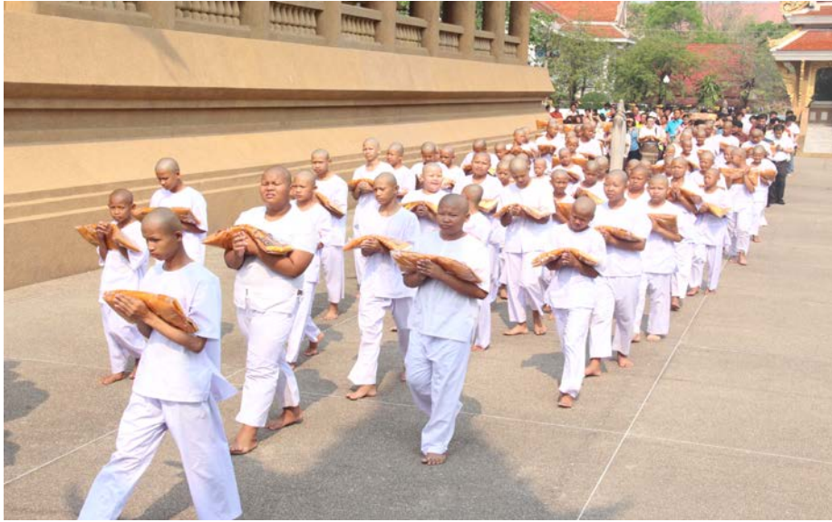
โครงการบรรพชาสามเณรภาคฤดูร้อน เสริมสร้างคุณธรรม จริยธรรม