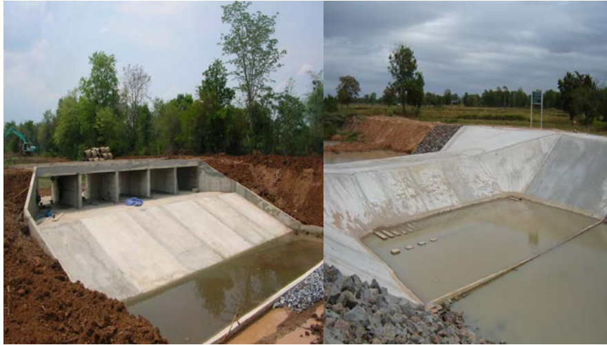
ก่อสร้างท่อเหลี่ยม / ก่อสร้างถนนน้ำล้นผ่าน