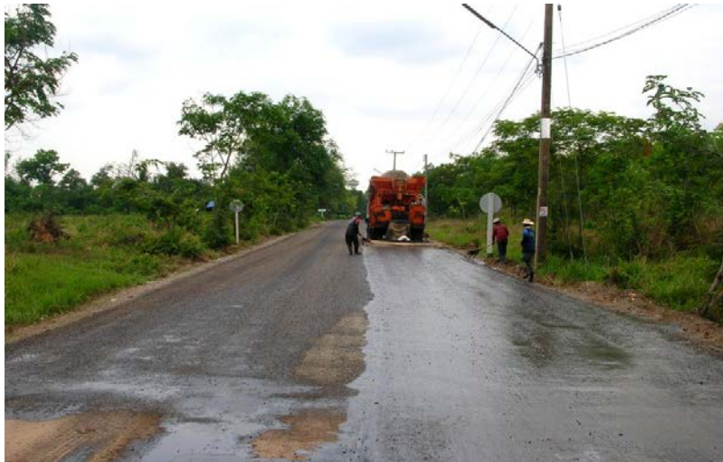
โครงการ ก่อสร้างถนนลาดยาง