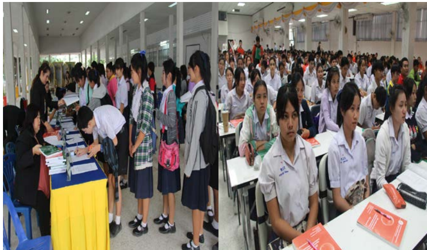
จัดอบรมพัฒนานักเรียนสู่ความเป็นเลิศทางวิชาการ