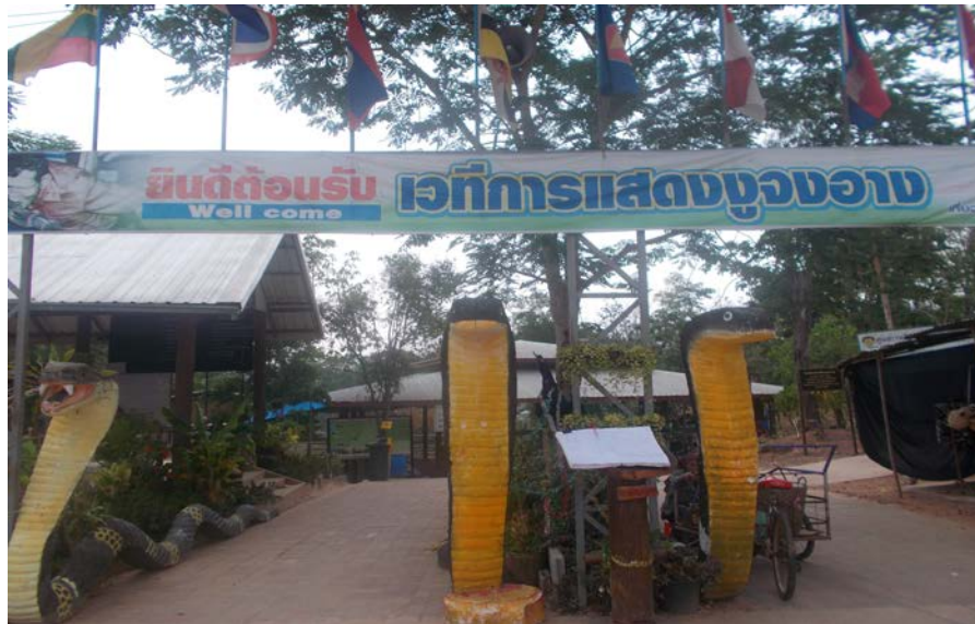
โครงการส่งเสริมการท่องเที่ยวหมู่บ้านงูจาง