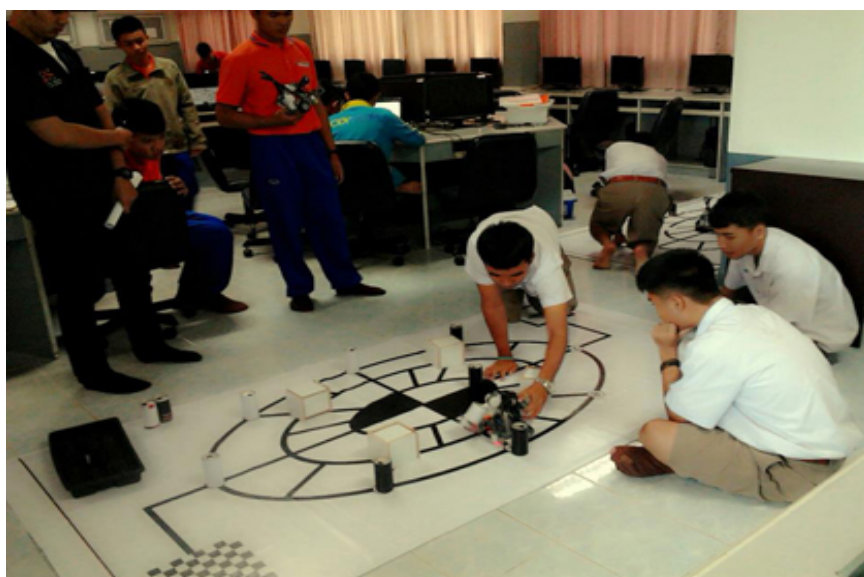
จัดการเรียนการสอนด้านนวัตกรรม ห้องเรียนหุ่นยนต์อัจฉริยะ