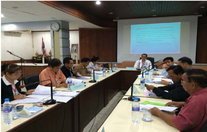
การประชุมคณะกรรมการฯ ในการทำงาน