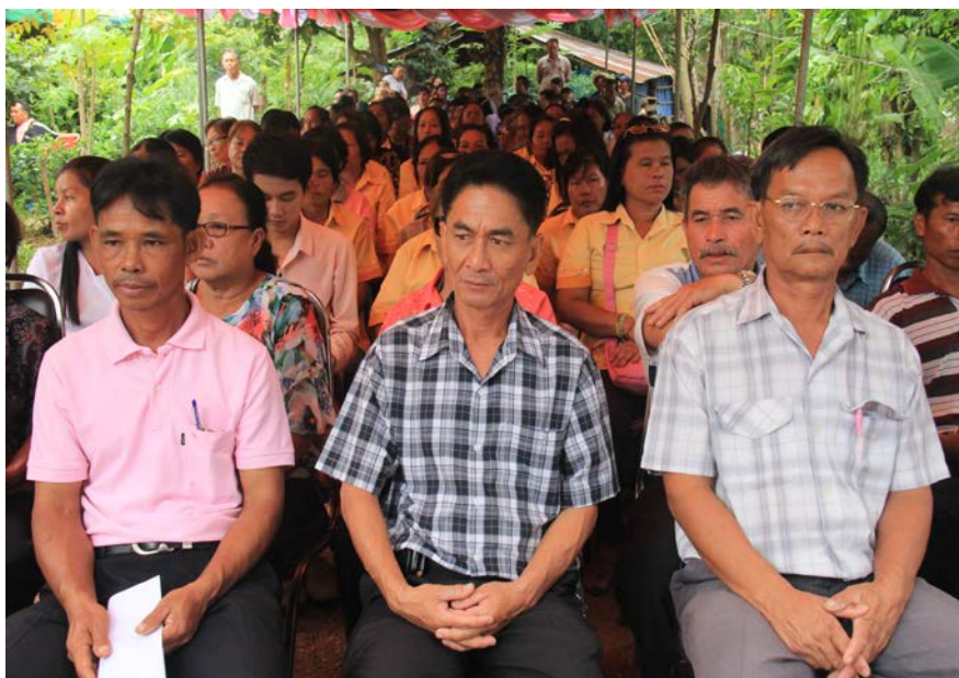
การสำรวจความคิดเห็นการมีส่วนร่วมของประชาชนในการพัฒนาท้องถิ่น