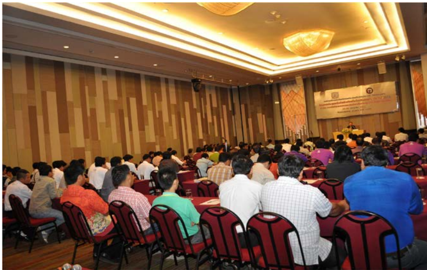
การประชุมสัมมนาฯ