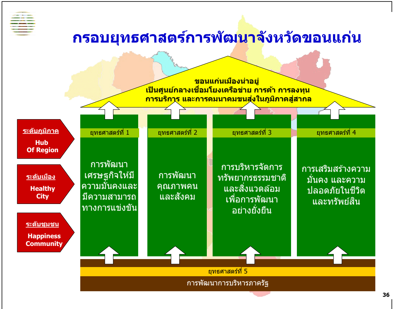
รูปที่ 10 แสดงกรอบยุทธศาสตร์การพัฒนาจังหวัดขอนแก่น