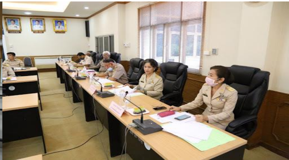
อบจ.ม.41/1 เทศบาล ม.48 เอกาทศ อบต.,ม.58/6