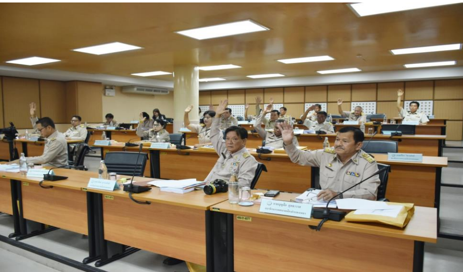
อบจ.ม.11(4) เทศบาล ม.19(5) อบต.ม. 47ตรี(4)